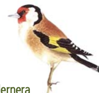
Cadernera Carduelis carduelis