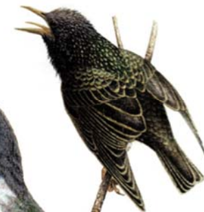
Estornell vulgar Sturnus vulgaris