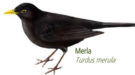
Merla Turdus merula