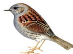
Pardal de bardissa Prunella modularis