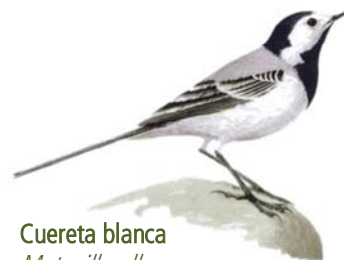
Cuereta blanca Motacilla alba