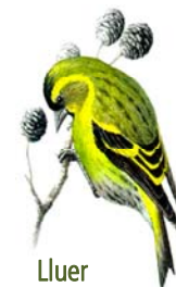
Lluer Spinus spinus