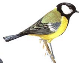
Mallerenga carbonera Parus major