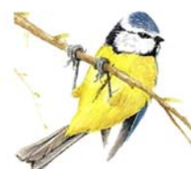
Mallerenga blava Cyanistes caeruleus