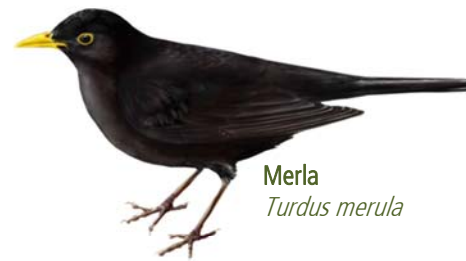
Merla Turdus merula