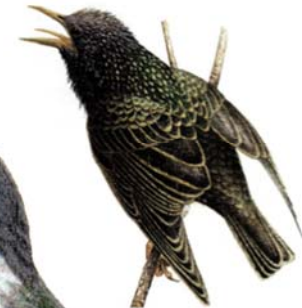
Estornell vulgar Sturnus vulgaris