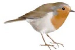
Pitroig Erithacus rubecula