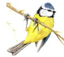
Mallerenga blava Cyanistes caeruleus