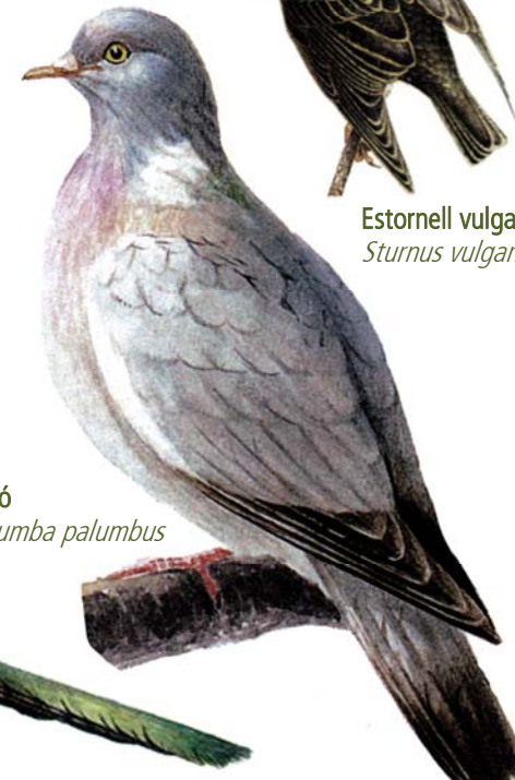
Tudó Columba palumbus