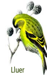
Lluer Spinus spinus