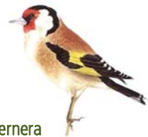
Cadernera Carduelis carduelis