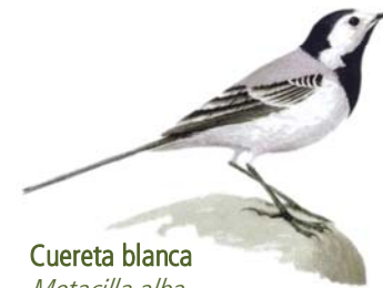
Cuereta blanca Motacilla alba