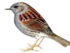
Pardal de bardissa Prunella modularis