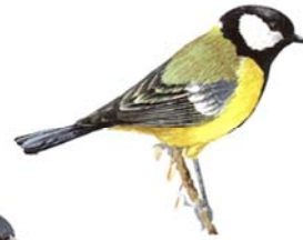
Mallerenga carbonera Parus major