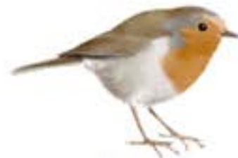
Pitroig Erithacus rubecula