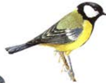
Mallerenga carbonera Parus major