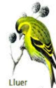
Lluer Spinus spinus