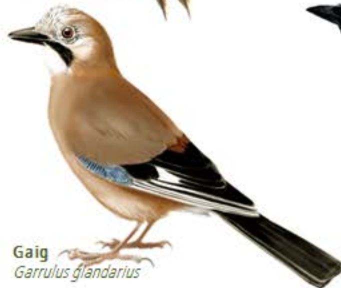
Gaig Garrulus glandarius