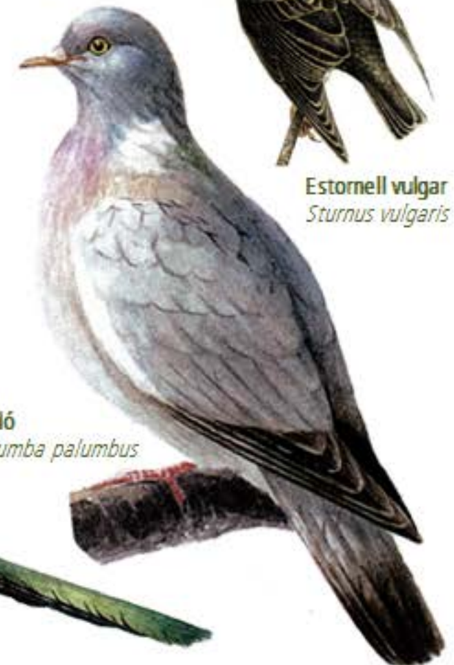
Tudó Columba palumbus