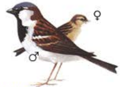
Pardal comú Passer domesticus