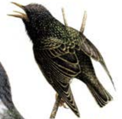
Estornell vulgar Sturnus vulgaris