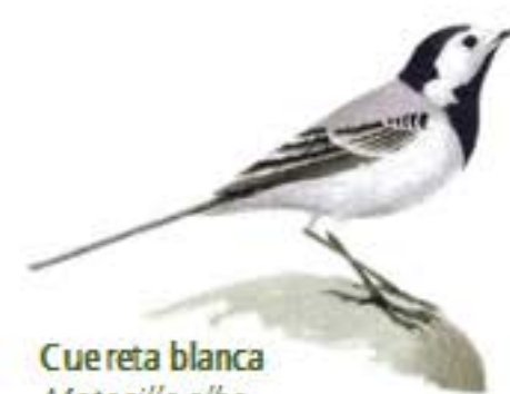
Cuereta blanca Motacilla alba