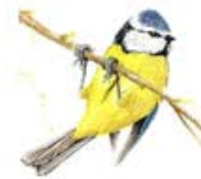
Mallerenga blava Cyanistes caeruleus