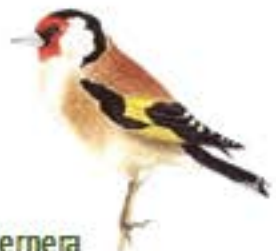
Cademera Carduelis carduelis