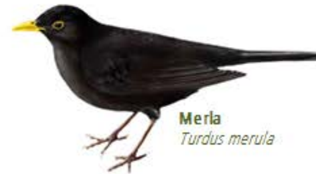
Merla Turdus merula