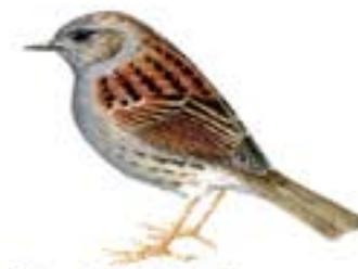
Pardal de bardissa Prunella modularis